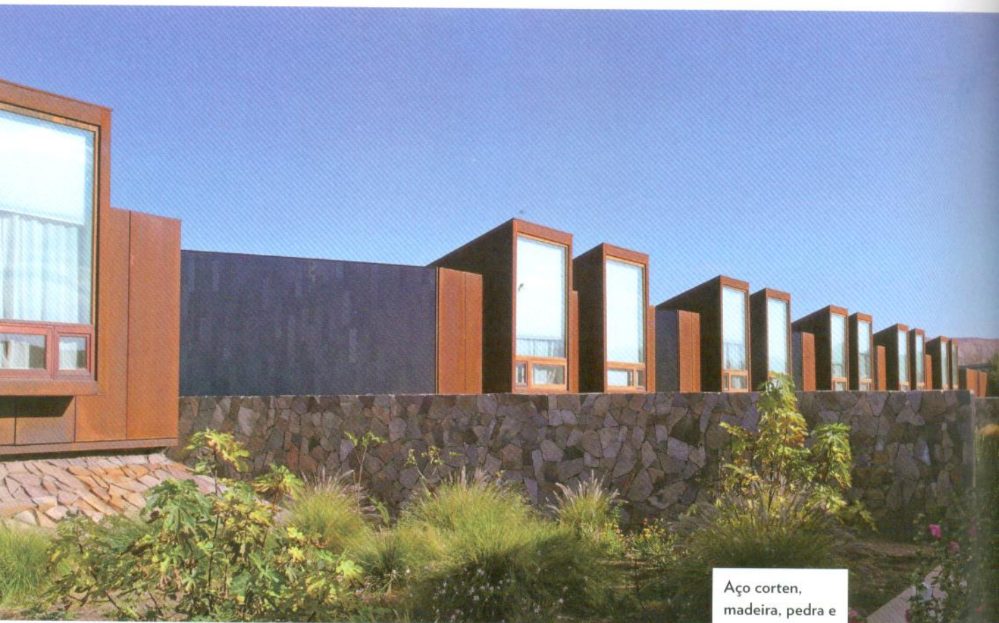
Aço corten, madeira, pedra e vidro, elementos de estilo do projeto

P acha mama, a mãe terra, a criadora de tudo. No extremo norte do Chile, a 2.400 metros de altitude, ela fez uma das suas mais caprichadas e instigantes criações: o Altiplano do Deserto do Atacama, região formada por acidentes geológicos descomunais, ocorridos há dezenas de milhões de anos. Hoje a região virou a meca do turismo ecológico, com forasteiros do mundo todo que buscam a experiência única de vivenciar o deserto inóspito, sua imensidão, suas cores e texturas, suas cordilheiras, salares, gêisers e vulcões. Tudo isso logo ali, nas cercanias de São Pedro do Atacama, pequena cidade-oásis de 2.500 habitantes, mas com infraestrutura turística e hoteleira de cidade grande. De pequenas pousadas, chamadas hostals,