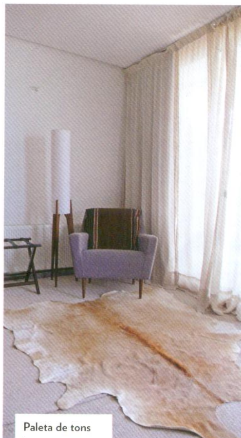
Paleta de tons terrosos nos ambientes comuns e quarto

O hotel organiza suas excursões pelas atrações locais com transporte exclusivo e guias que sabem tudo da região – e protegem os turistas desavisados de possíveis excessos, pois a vida não é lá muito fácil aos 4.600 m e 19 graus negativos. As emoções são muitas, o ar é pouco e o cansaço bate forte, mas a volta ao hotel é revigorante. No spa com menu de serviços imenso, piscinas aquecidas, open bar e gastronomia de primeira finalizam muito bem um dia de aventuras. ■