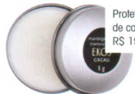
Protetor labial de cacau, R$ 19, Natura