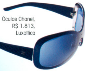
Óculos Chanel, R$ 1.813, Luxottica