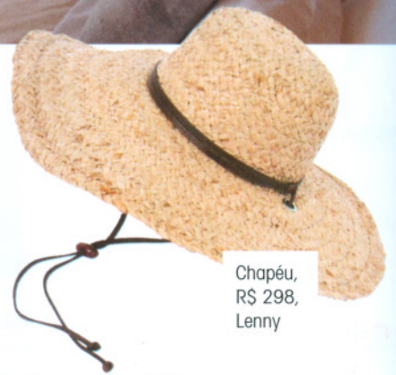
Chapéu, R$ 298, Lenny