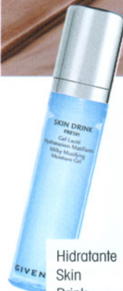
Hidratante Skin Drink, R$ 184, Givenchy